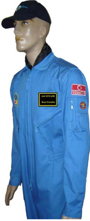
RESİM – 1 GENÇ KANAT SOLDAN GÖRÜNÜM