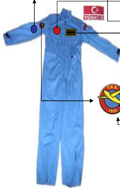
GENÇ KANATLAR TOPLULUĞU TULUM