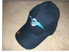
GENÇ KANATLAR TOPLULUĞU ŞAPKASI