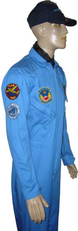
RESİM – 3 GENÇ KANAT SAĞDAN GÖRÜNÜM