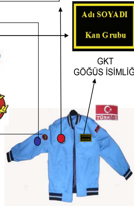
GENÇ KANATLAR TOPLULUĞU MONT