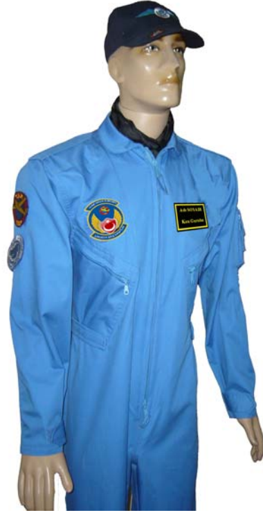
RESİM - 2 GENÇ KANAT ÖNDEN GÖRÜNÜM