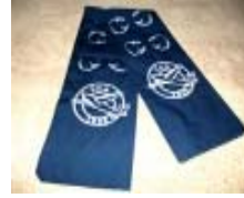
GENÇ KANATLAR TOPLULUĞU FULARI