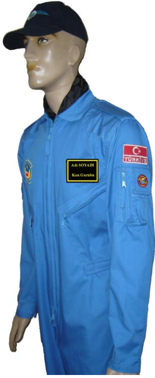
RESİM - 1 GENÇ KANAT SOLDAN GÖRÜNÜM