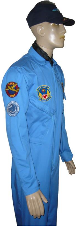
RESİM - 3 GENÇ KANAT SAĞDAN GÖRÜNÜM