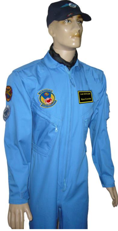
RESİM - 2 GENÇ KANAT ÖNDEN GÖRÜNÜM